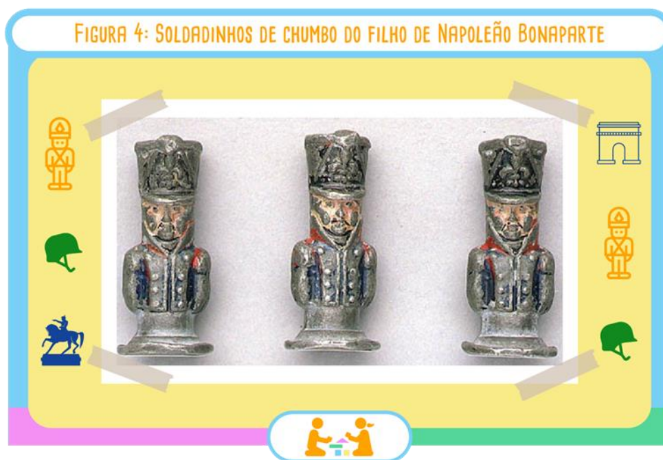
Figura 4: Soldadinhos de chumbo do filho de Napoleão Bonaparte.