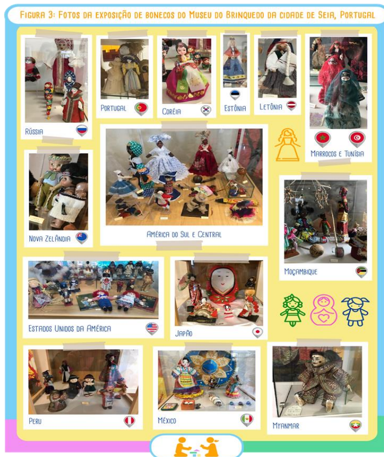
Figura 3: Fotos da exposição de bonecos do Museu de Brinquedo da cidade de Seia, Portugal.