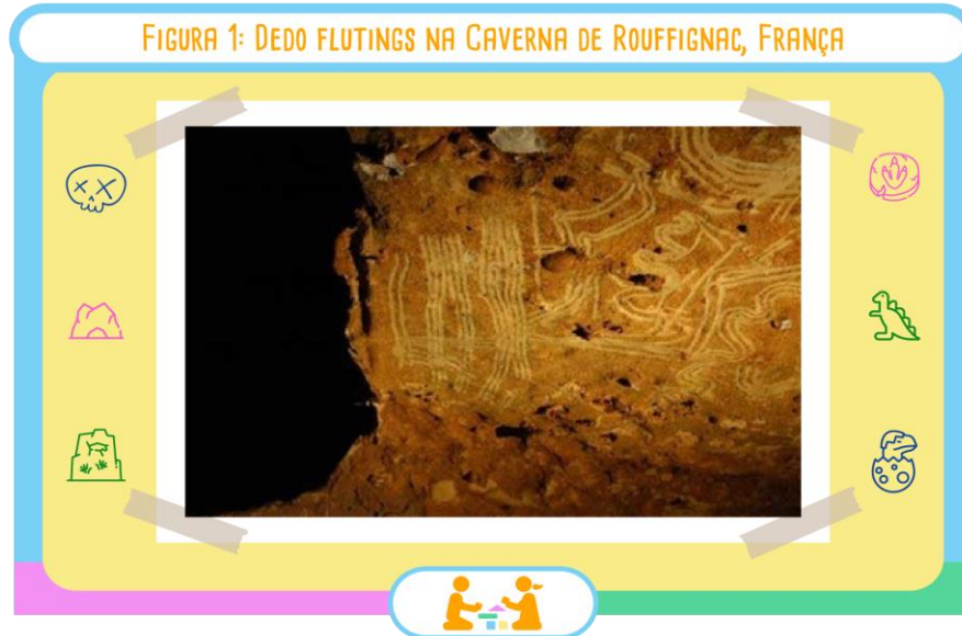
Figura 1: Dedo flutings na Caverna de Rouffignac, França.